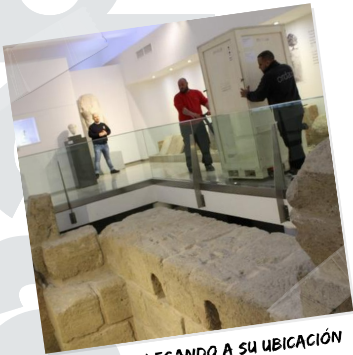
EL EFEBO LLEGANDO A SU UBICACIÓN