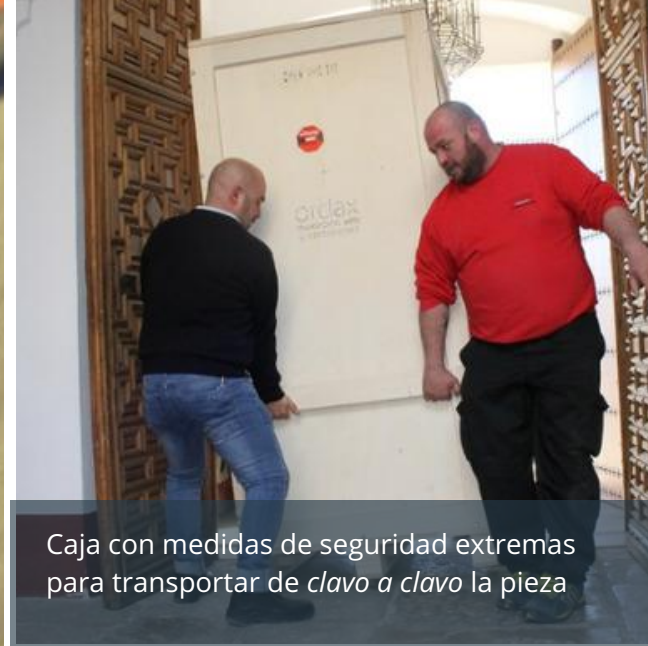
Caja con medidas de seguridad extremas para transportar de clavo a clavo la pieza