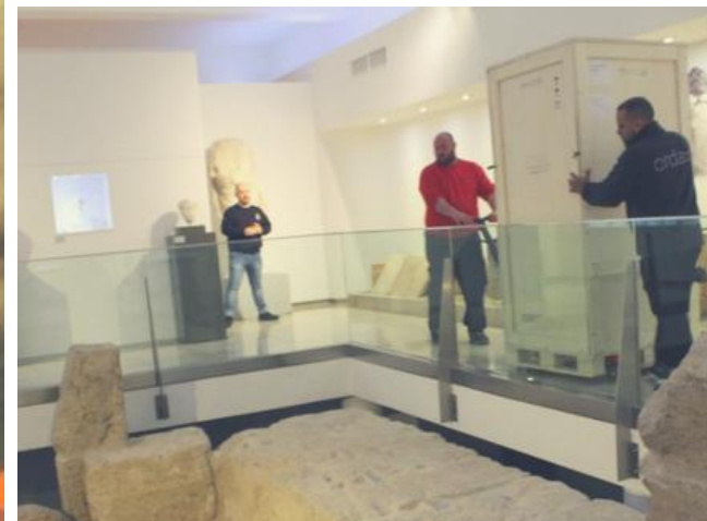
Llegada triunfal a su ubicación habitual, en la Sala IV Roma, dentro del MVCA