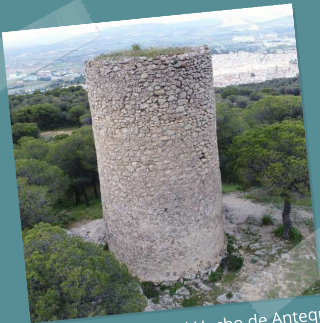
Característica Torre del Hacho de Antequera