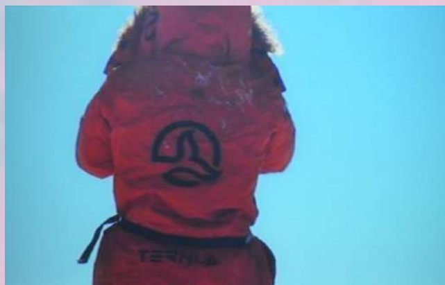
SOLA ANTE EL HIELO de Chus Lago