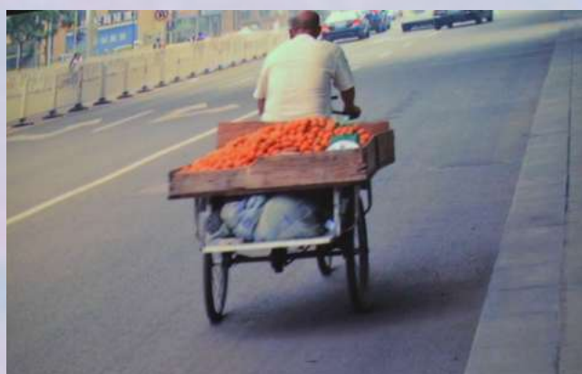
RAILWAY TO HEAVEN de Alexis Racionero