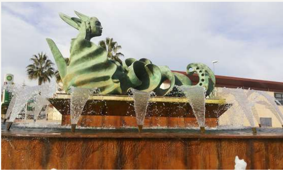
‘Alegorías del mar’, en bronce