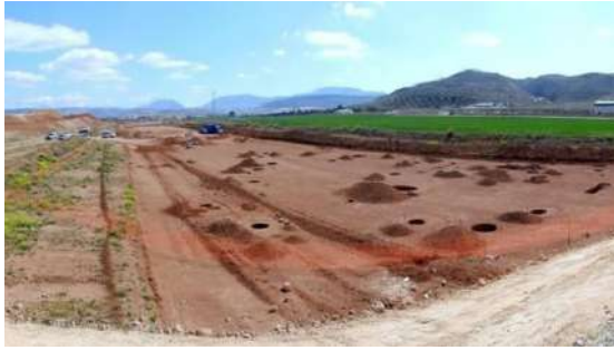
◀ Arroyo Saladillo ▼ Ídolos antropomorfos. Arroyo Saladillo