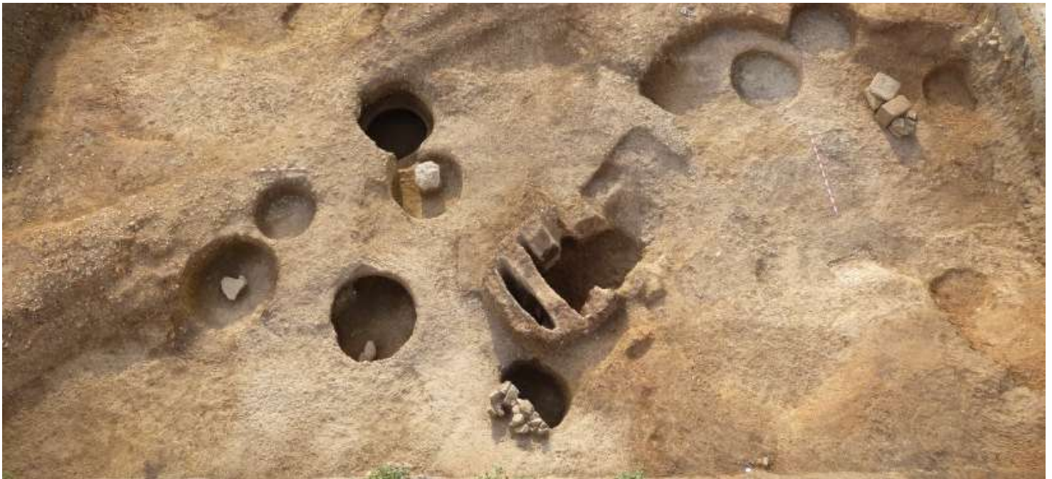
Huerta del Ciprés

La buena noticia es que la investigación y el conocimiento de nuestra Historia y del Patrimonio Arqueológico, en general, se han multiplicado exponencialmente durante estos años de construcción de la L.A.V. Granada- Bobadilla. Vamos a exponer, de manera sintética y siguiendo un discurso cronológico cultural, este capítulo lo dedicamos a un periodo muy concreto, la Prehistoria, los principales aportes que estos yacimientos han realizado a la Historia de las `Tierras de Antequera´.