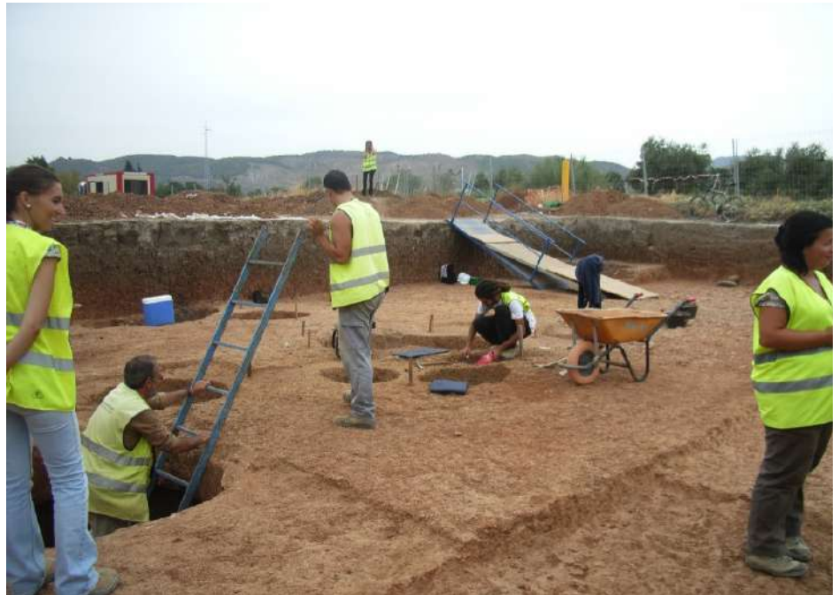
Huerta del Ciprés. A 750 m. de Los Dólmenes

La última prospección arqueológica que se realizó para la traza del AVE Granada-Bobadilla a su paso por el T.M. de Antequera que, finalmente ha sido la definitiva, dictaminaba que de llevarse a cabo el proyecto previsto se traduciría en diferentes grados de impacto sobre más de 30 yacimientos arqueológicos en nuestro municipio (traza, caminos de servicio, zonas de préstamos etc.). A pesar de todo ello el diseño de la traza actual siguió adelante, lo que obligó a que, durante casi cuatro años, se realizaran trabajos arqueológicos en toda la obra, con los consiguientes problemas de gestión, conservación y protección que plantean este tipo de intervenciones.