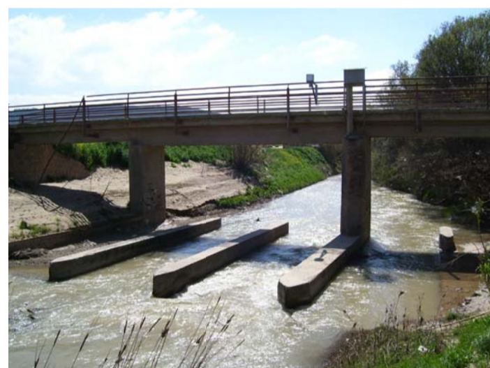
AMPLIACION DE LA ESTRUCTURA, QUE DA CONTINUIDAD DESDE LA CALLE SAN LUIS A UN CAMINO RURAL, ADAPTÁNDOSE AL ENCAUZAMIENTO PROPUESTO.