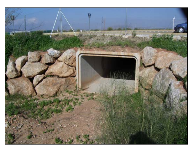
EMBOVEDADO EXISTENTE DE CAPACIDAD INSUFICIENTE