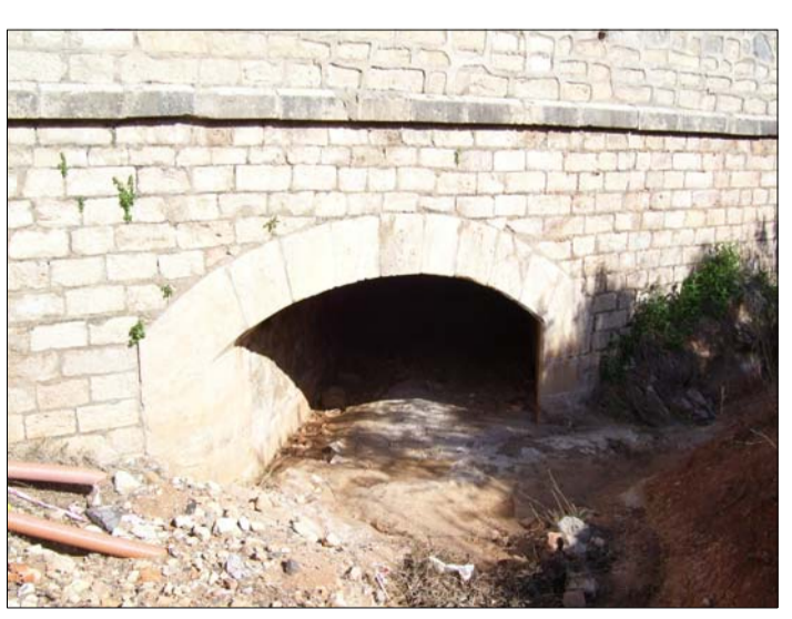
EMBOVEDADO EXISTENTE DE CAPACIDAD INSUFICIENTE