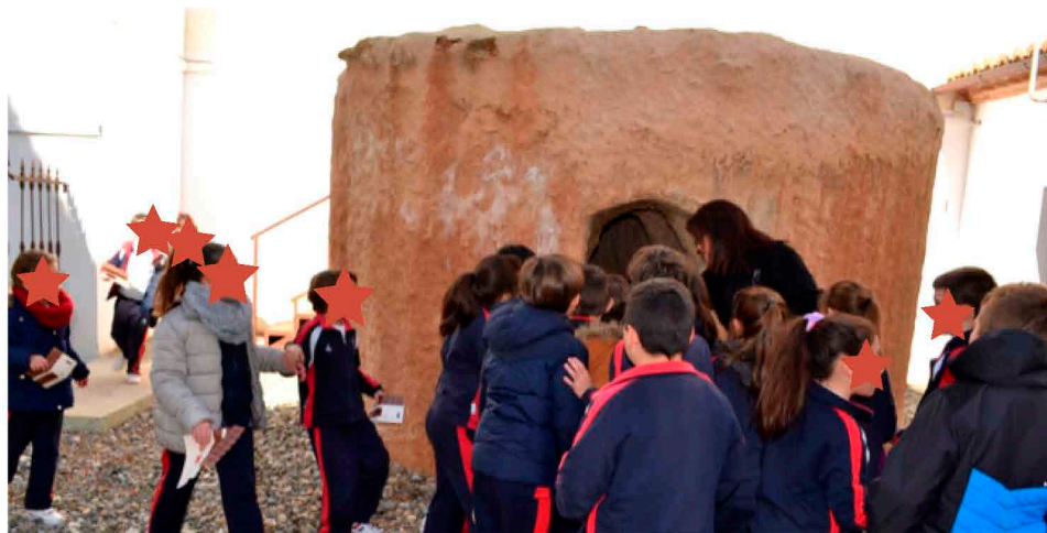
Horno romano de enormes dimensiones, siendo visitado por los alumnos

El uso y formas de trabajar con un horno de origen romano es una de las nuevas apuestas del departamento pedagógico del MVCA. El taller nace con el fin de acercar a los pequeños una nueva forma de entender la sociedad romana, con una pieza tan importante. Los soportes de manualidades y audiovisuales completan la nueva propuesta didáctica del MVCA.