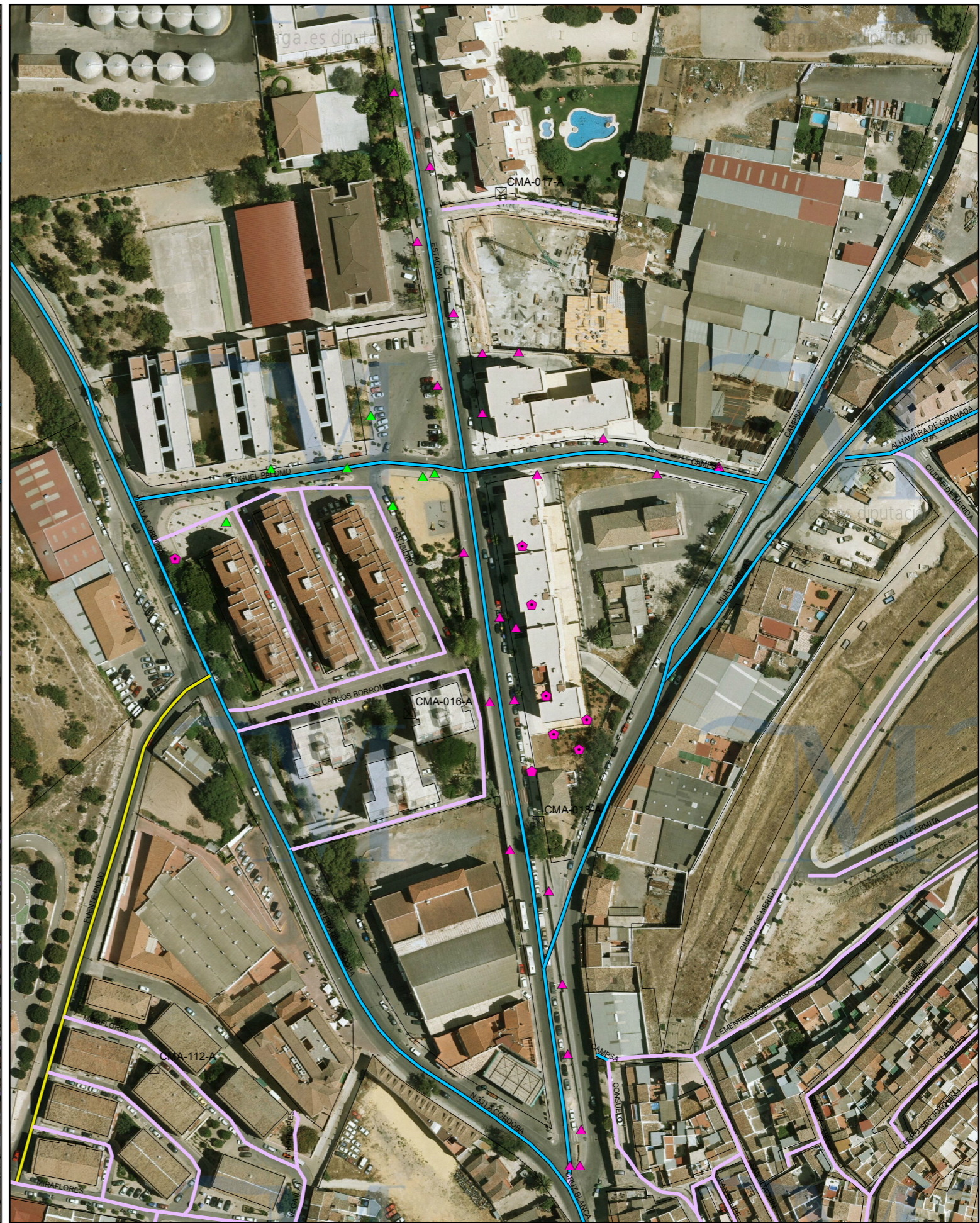
SITUACIÓN FUTURA SEGÚN PDASA