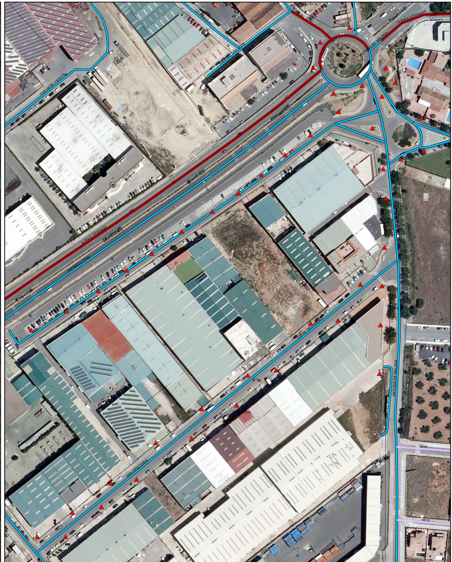
SITUACIÓN FUTURA SEGÚN PDASA