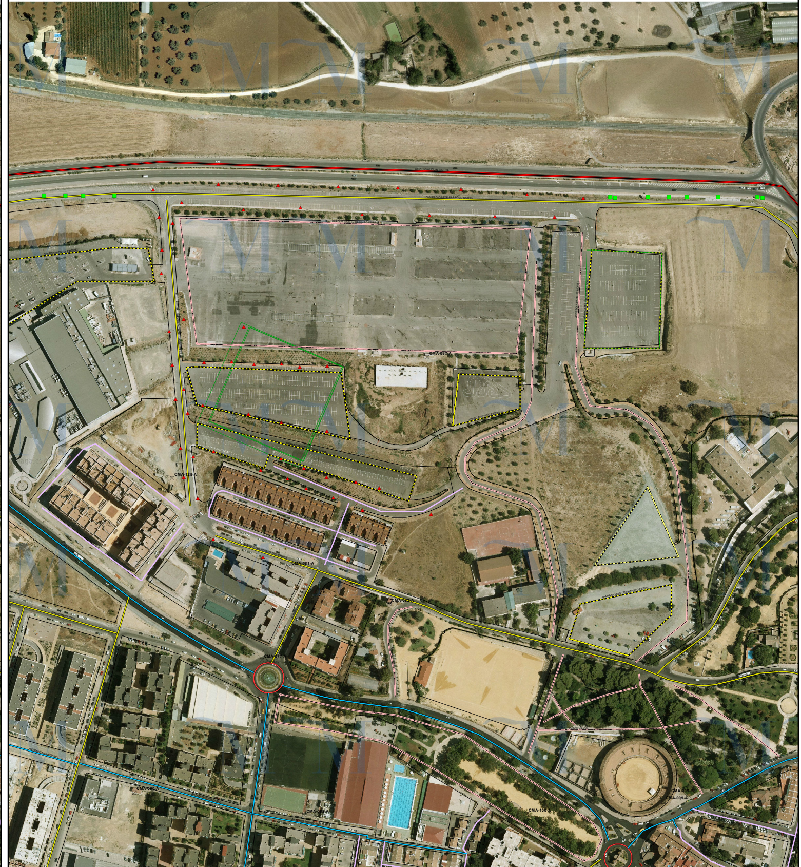
SITUACIÓN FUTURA SEGÚN PDASA