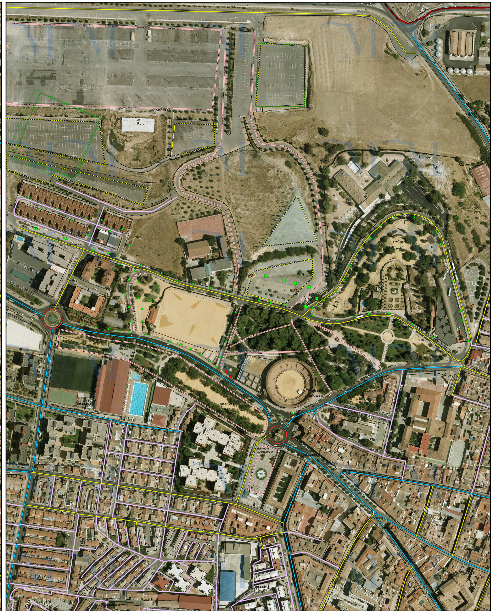
SITUACIÓN FUTURA SEGÚN PDASA