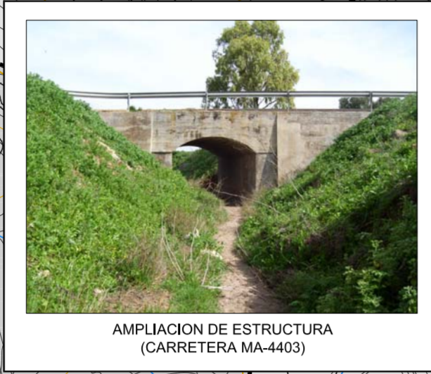
AMPLIACION DE ESTRUCTURA (CARRETERA MA-4403)