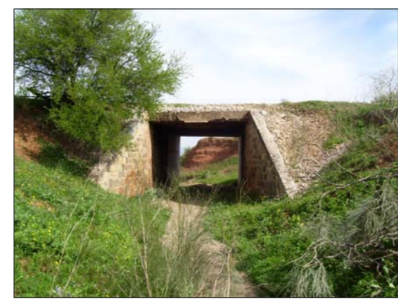
AMPLIACION DE ESTRUCTURA (LINEA FFCC MALAGA-CORDOBA)