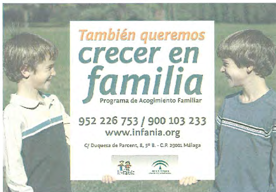
Campaña Crecer en Familia 2012

En virtud de la resolución de la Consejería de Asuntos Sociales con fecha 25 de Enero de 1.999, se habilitó a INFANCIA como Institución Colaboradora de Integración Familiar (I.C.I.F.), según el Decreto 454/96 de la Junta de Andalucía. Esta resolución le habilita para intervenir en labores de mediación en los acogimientos familiares temporales, simples y permanentes, de menores tutelados por la Delegación Provincial de la Consejería de Asuntos Sociales en Málaga.