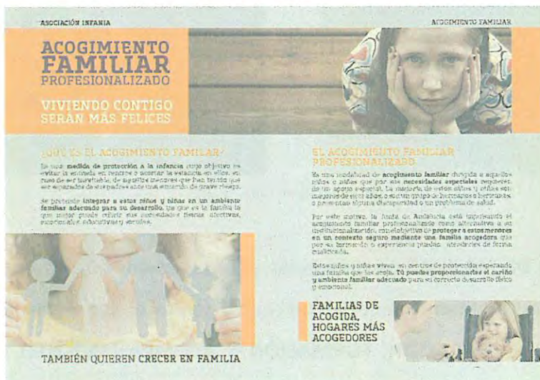
Campaña Acogimiento Familiar Profesionalizado 2014