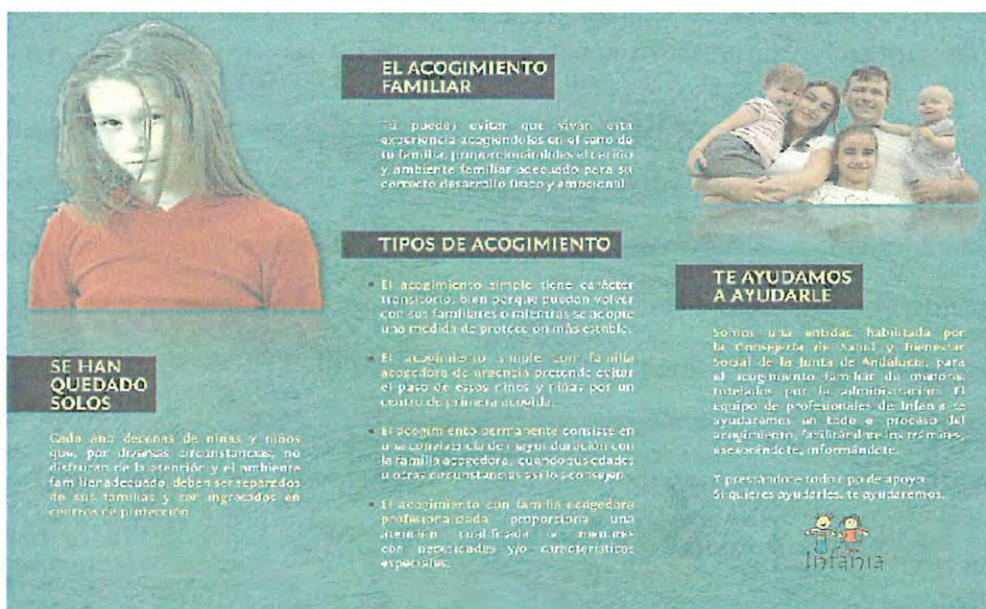
Folleto Campaña Crecer en Familia 2012