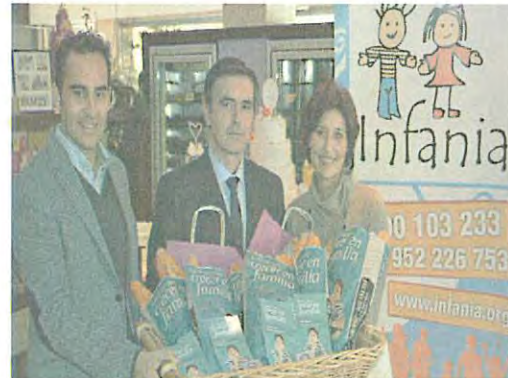
Campaña Difusión 2014 y 2015

CAPTACIÓN DE FAMILIAS concienciadas y sensibilizadas que deseen ayudar a estos menores evitando así su internamiento en un centro de protección. Estas familias necesitan de INFORMACIÓN, PREPARACIÓN, FORMACIÓN Y ACOMPAÑAMIENTO durante todo el proceso de acogimiento por parte de los profesionales de INFANCIA, para hacer frente a la nueva situación que va a vivir la familia y que es el acogimiento familiar. Esta preparación y formación se lleva a cabo antes, durante y después de esta medida de protección, haciendo una mayor incidencia en las habilidades educativas que debe adquirir la familia y en la