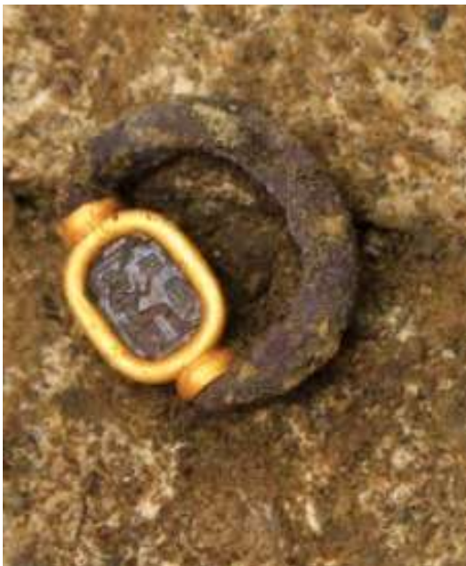
Imagen de la pieza detallada en los datos. Se aprecia en el interior, la flor con los ocho pétalos.