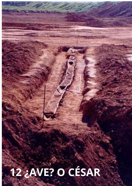
12 ¿AVE? O CÉSAR