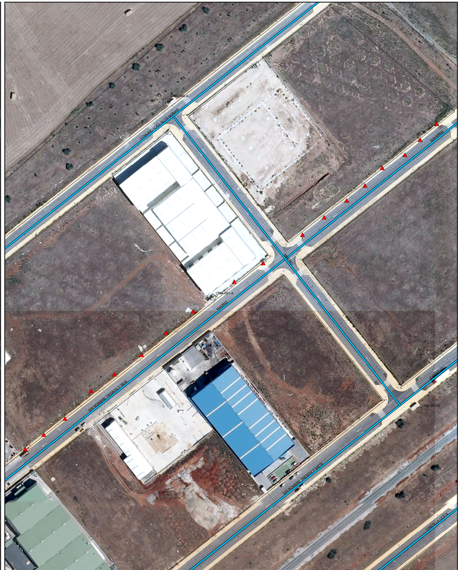
SITUACIÓN FUTURA SEGÚN PDASA