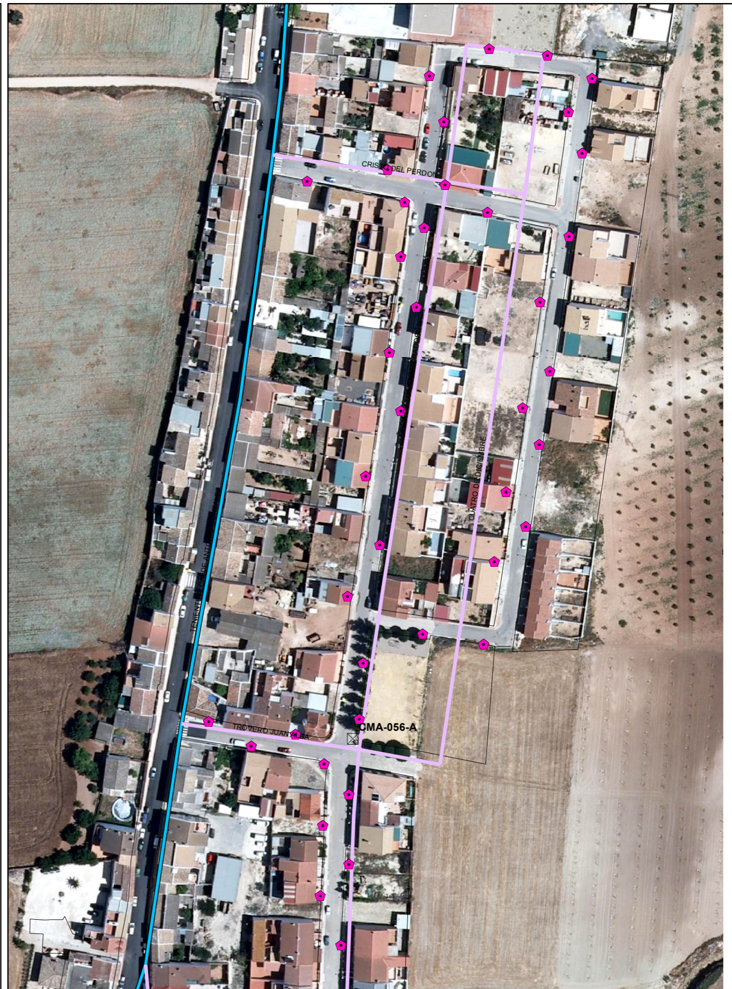
SITUACIÓN FUTURA SEGÚN PDASA