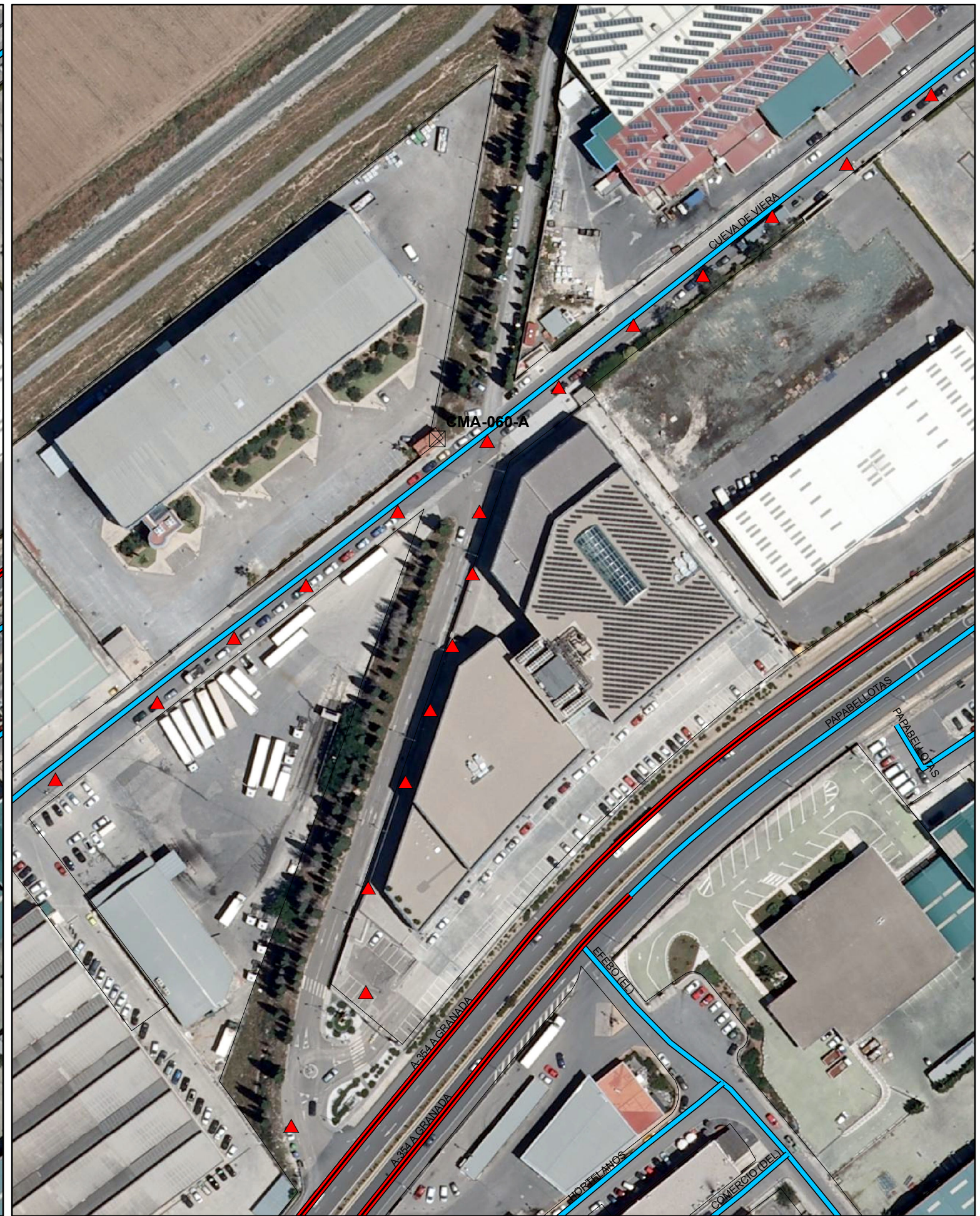
SITUACIÓN FUTURA SEGÚN PDASA