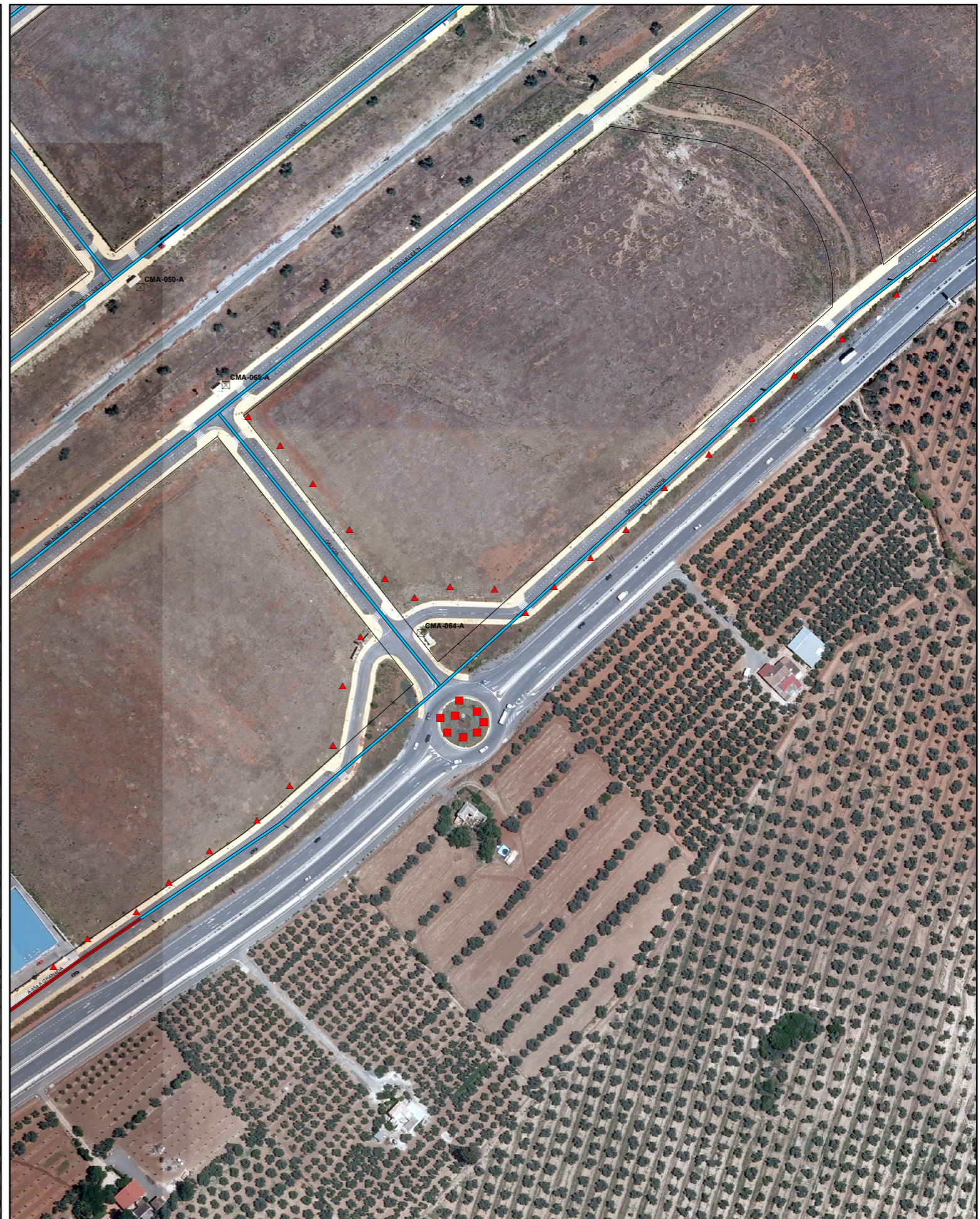
SITUACIÓN FUTURA SEGÚN PDASA