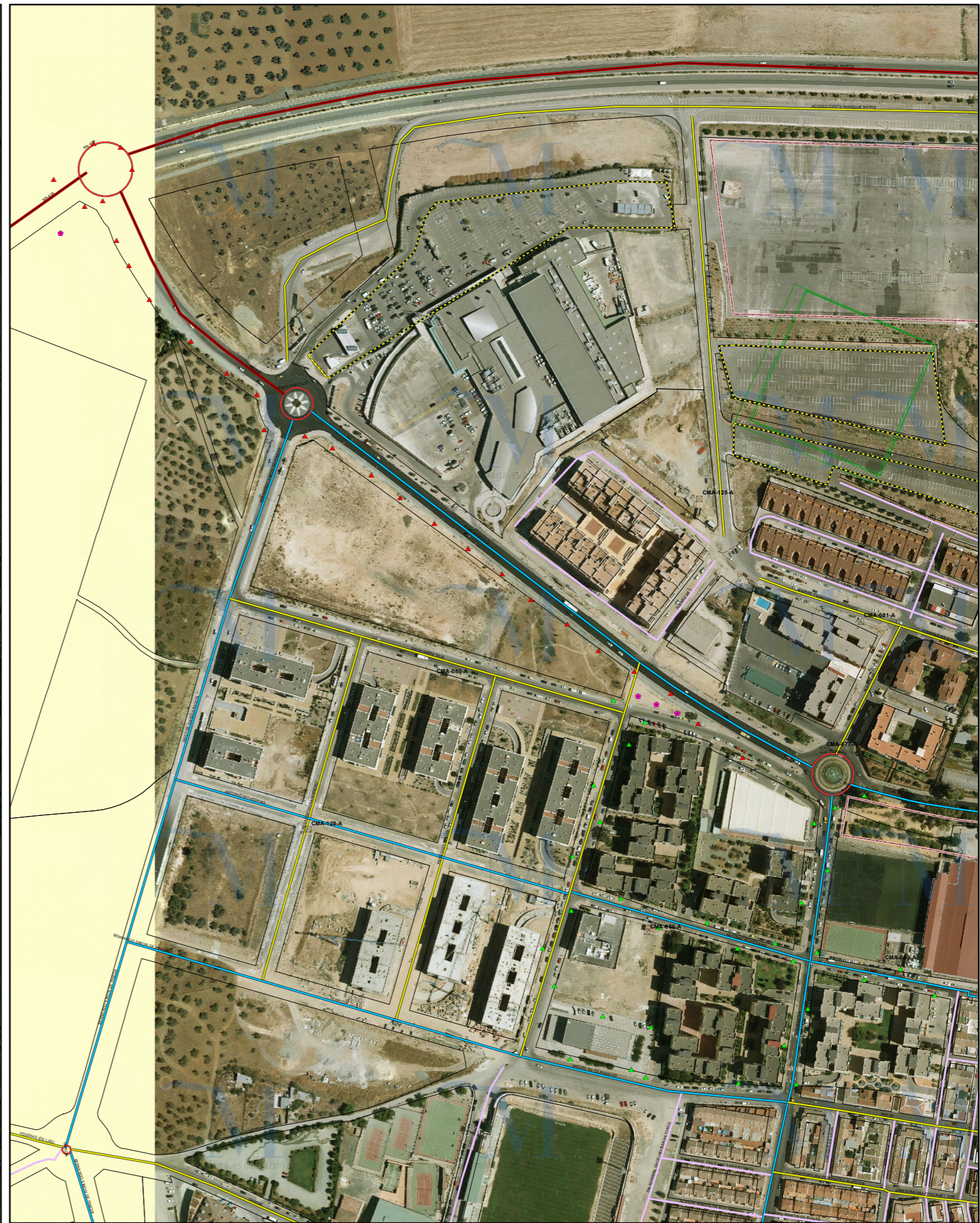
SITUACIÓN FUTURA SEGÚN PDASA