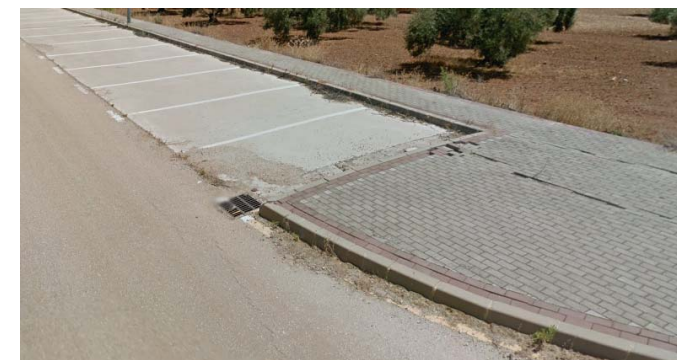
Imbornal existente en línea de aparcamientos del vial existente fase 1

Para la ejecución de la red de saneamiento, se producirán diversos cruces con los imbornales que quedan en la margen este del vial, los cuales debido a la profundidad de las obras a realizar, y las dimensiones de las mismas, se considera necesario valorar la reposición de los mismos.