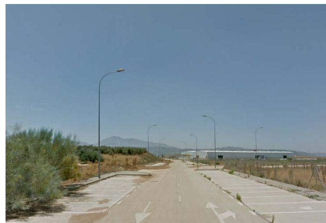
Estado actual del vial existente Fase 1.

Aunque las actuaciones previstas, discurren por calzada, se prevé la reposición de la red de alumbrado actual, y protección de las canalizaciones. Pudiendo verse estas afectadas durante la ejecución de las obras.