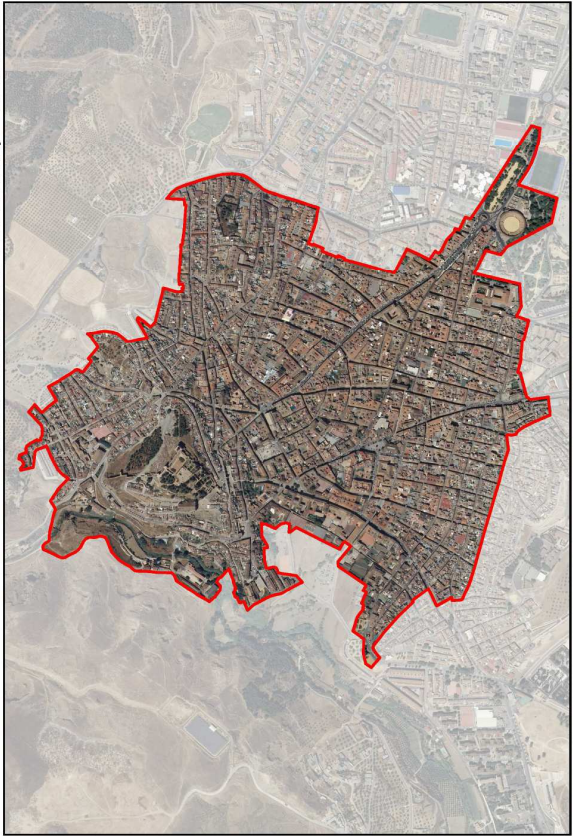
ORTOFOTO. LIMITE PEPRÍ APROBADO EN 1993