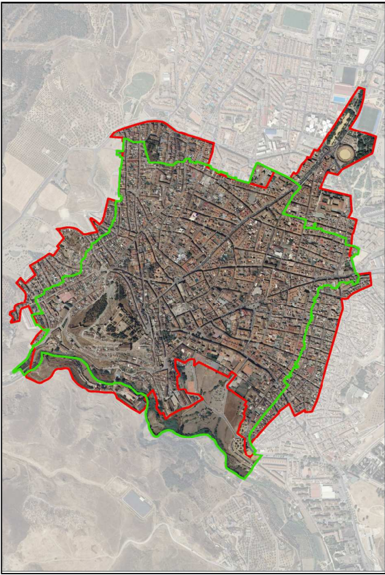
ORTOFOTO. LIMITES DEL CHA INSCRITO COMO BIC Y PEPRÍ APROBADO EN 1993