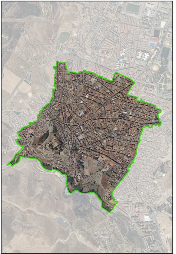
ORTOFOTO. LIMITE DEL CHA INSCRITO COMO BIC