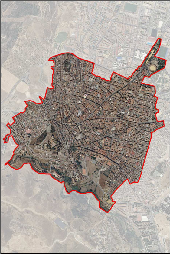
ORTOFOTO LIMITE DE PEPRÍ PROPUESTO