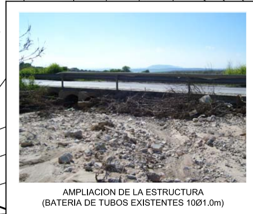
AMPLIACION DE LA ESTRUCTURA (BATERIA DE TUBOS EXISTENTES 10x1.0m)