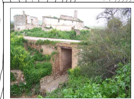
AMPLIACION DE ESTRUCTURA (CAMINO)