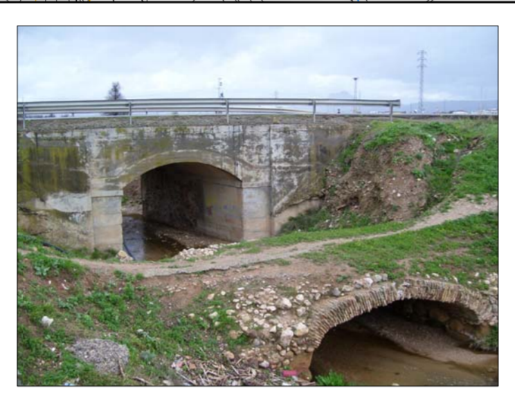
AMPLIACION DE ESTRUCTURA (CARRETERA MA-4403)