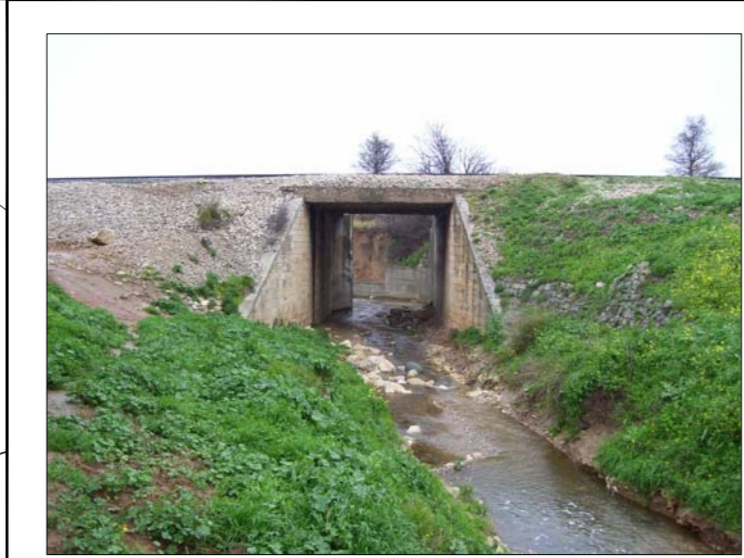
AMPLIACION DE ESTRUCTURA (LINEA FFCM MALAGA-CORDOBA)