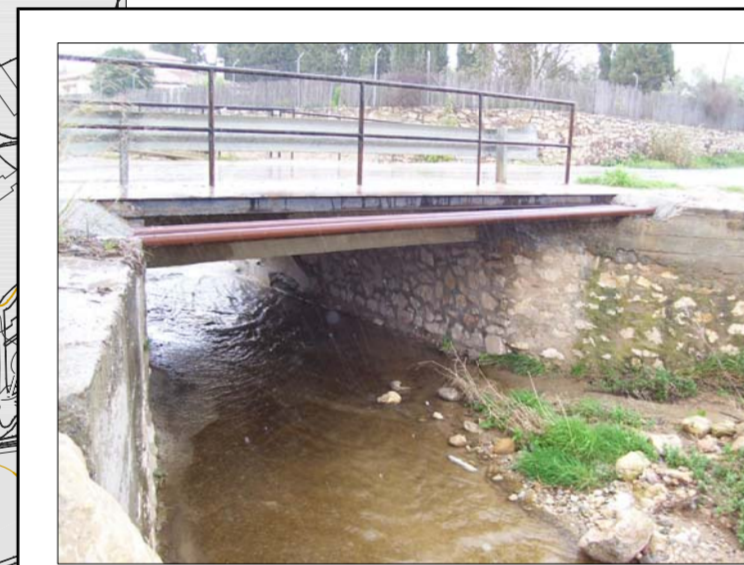
AMPLIACION DE ESTRUCTURA (CAMINO GANDIA)